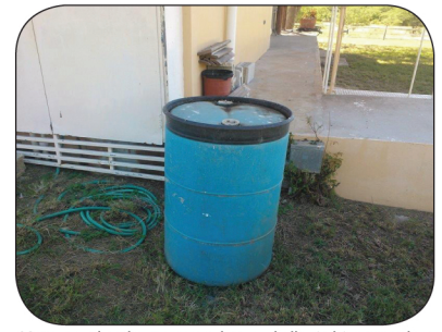
Mantenga los drones para el agua de lluvia bien tapados.