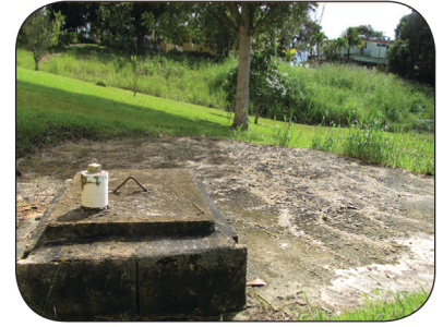
Mantenga el pozo séptico sellado.