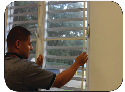
Instale o repare las telas metálicas o escrines de ventanas y puertas.