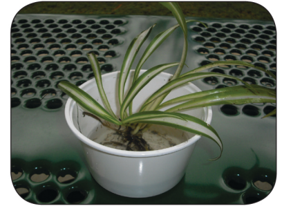
Ponga las plantas en tierra, no en agua.