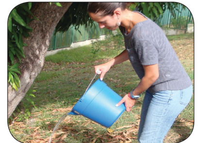
Vacíe el agua acumulada.