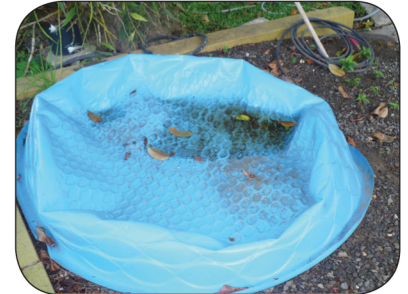
Vacíe las piscinas que no estén en uso.