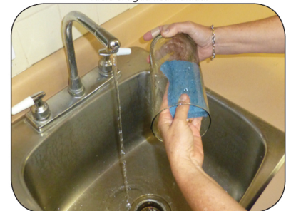
Restriegue los floreros y envases semanalmente para eliminar los huevos de mosquitos.