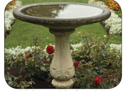
Vacíe el agua acumulada en fuentes y baños para pájaros semanalmente.