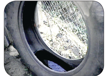
Recicle las gomas usadas o manténgalas protegidas de la lluvia.